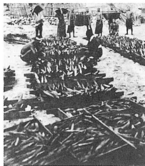
写真は、上右から各島の行政管理標識、尖閣沖での漁民救助に対する中華民国からの感謝状、魚釣島で働く人々、盛んなカツオ漁業の様子、下は工場前での記念写真と魚釣島の入港の様子

▼「みずき」乗組員の証言によれば「自分たちも乗組員も漁船に衝突して死んでしまう」「まともに船首が乗組員に当たったら、死んでしまう」等と恐怖やあせりを述べた。巡視船の損傷はおろか、人命を危険にさらす行為であった。▼中国人船長は、自分の船の組員に、「(中国の)漁船が日本に捕まったことはない。撃つてこない」「巡視船に撃つ勇氣なんて絶対がない」と述べた。日本領海の警備を軽視し、追跡されても逃走できると考えていた。